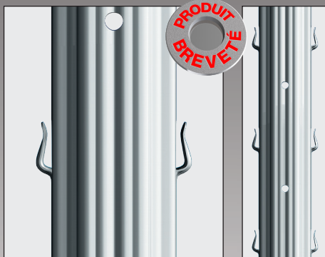
Face avant avec perçage pour pose accessoires